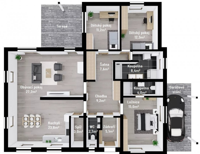
DŮM GABRIELA STUDIE FIRMY FUTUR