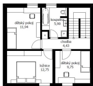
DŮM ELIŠKA STUŽIE PŘÍRHY FUTUR