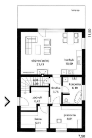
DOM ČESTMÍR STUŽBA FIBRY FUTUR