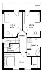
DOM ČESTMÍR STUŽBA FIBRY FUTUR