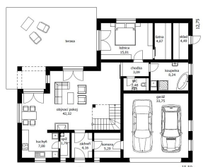
15,50 00h SANDRA STUPEŇ PRVÝ FUTUR