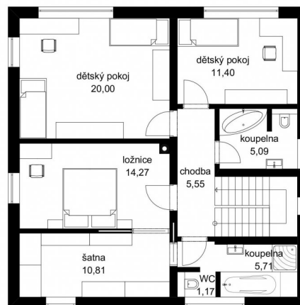
DŮM REGINA II STUDIE FIRMY FUTUR