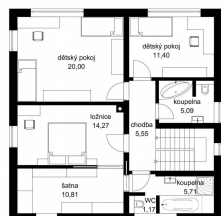
DŮM REGINA II STUDIE FIRMY FUTUR