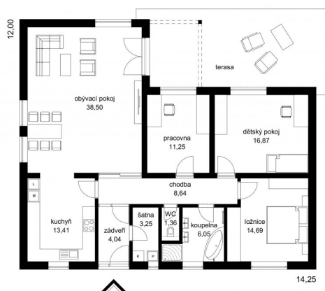
DŮM LAURA STUDIE FIRMY FUTUR