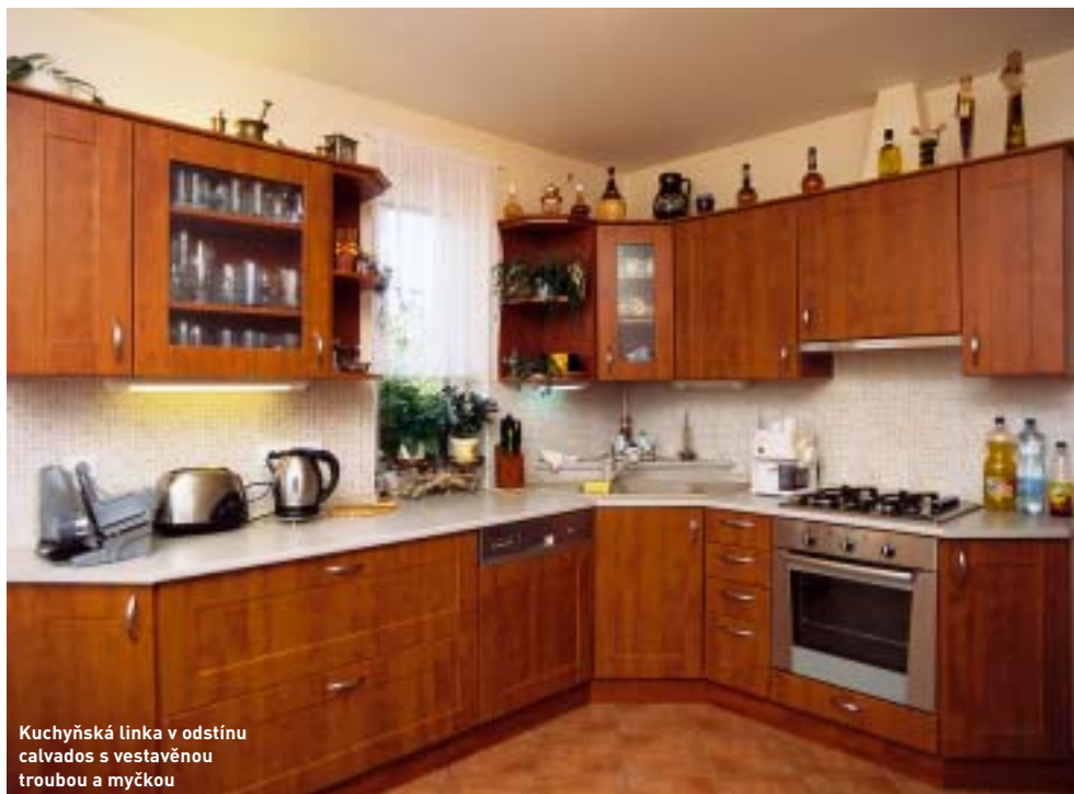
Kuchyňská linka v odstínu calvados s vestavěnou troubou a myčkou