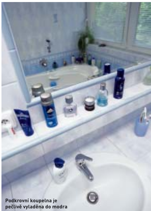
Podkrovní koupelna je pečlivě vyladěna do modra