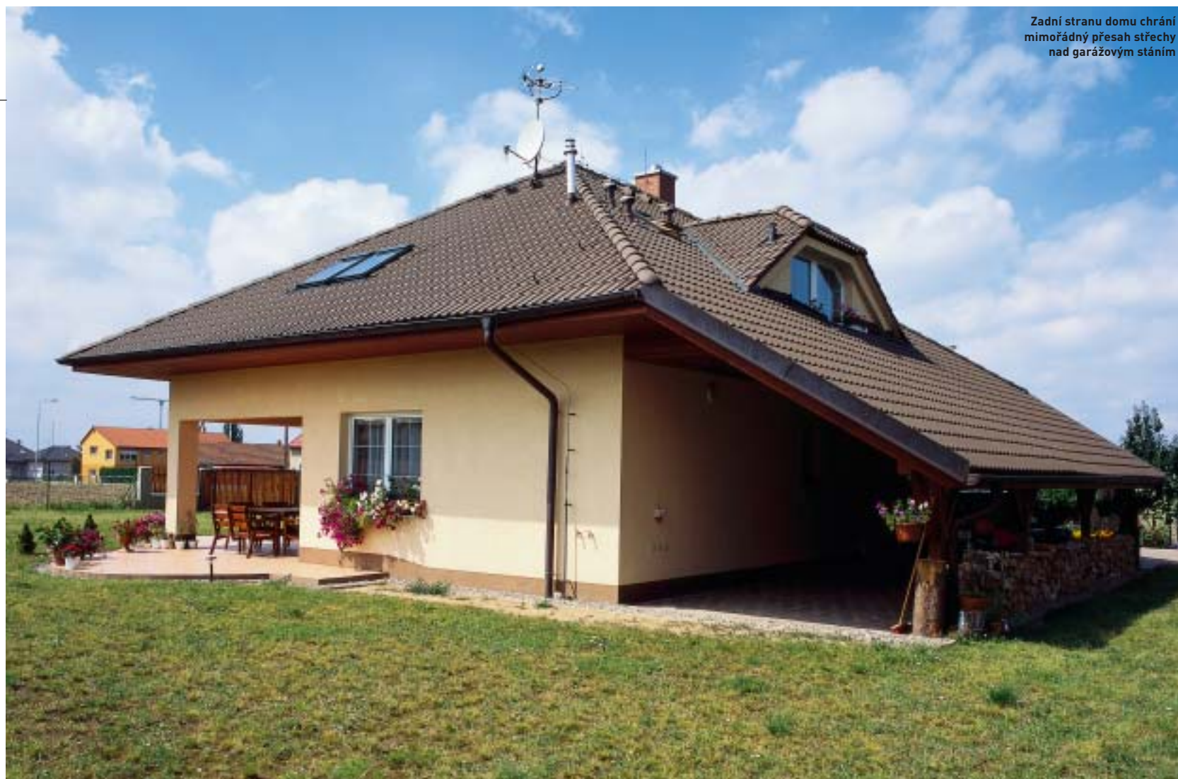
Zadní stranu domu chrání mimořádný přesah střechy nad garážovým stánkem

Schodiště do podkroví má stupně z buku mořeného do odstínu třešně, v němž byly provedeny i všechny dveře. Dům se může pochlubit dostatkem úložných prostor: komorami pod schodištěm a v podkroví a půdičkou nad ložnicí. Nábytek je převážně sektorový (dovoz z Polska), v koupelnách a na WC zahřeje podlahové topení. Podkrovní koupelna v odstínu modravých vln (návrh je dílem paní domu) si vás získá také estetickým detailem – vanou s podomítkovou baterií, jejíž sprchová hadice zůstává pomocí závaží zapuštěna do zdi. ▶