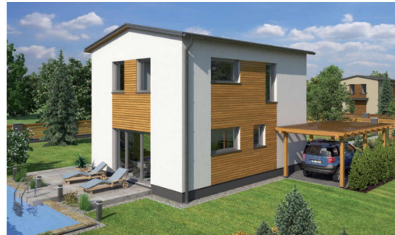
NOVINKA 2013 – RODINNÝ DŮM DITA OD SPOLEČNOSTI FUTUR