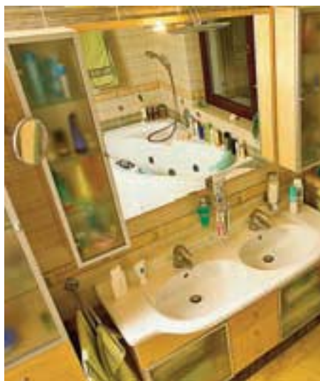
Rodinná koupelna s masážní vanou a samostatným sprchovým koutem je pojata jako relaxační prostor