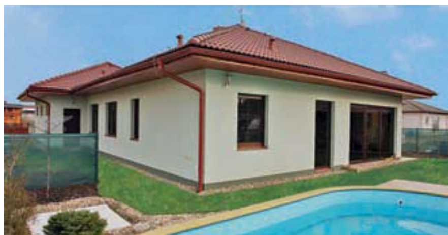
Hmota domu se skládá z hlavní obytné části a předsazeného zázemí s garáží, nízký krov a přesah střech stavbu opticky zmenšují