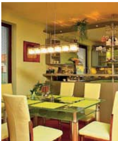
Kuchyňský kout tvoří linka ve tvaru „U“, praktický pultík kout odděluje od jídelní části