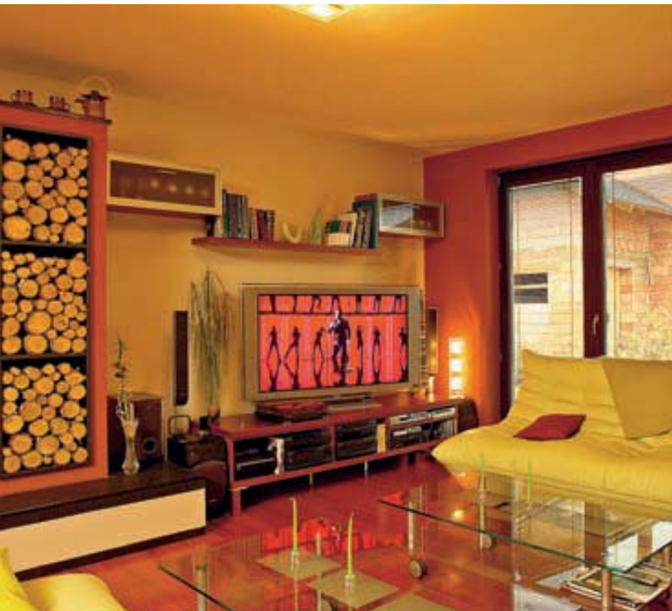
Obývací část s velkoryse řešeným sezením. Zásoba dřeva čeká na svou chvíli v krbu a zároveň slouží jako zajímavá dekorace